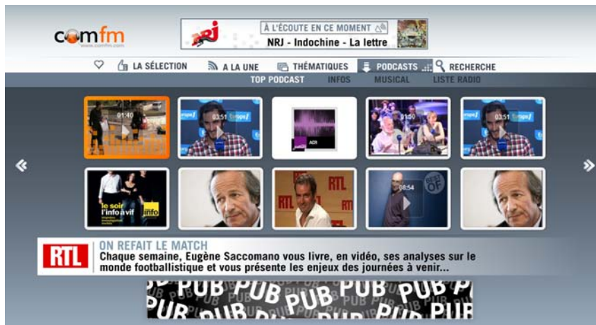
COMFM : Présentation du service Podcast

COMFM, 1 er portail de Radio en France lance son service multi support TV, PC et tablet PC en partenariat avec Toshiba. Aujourd'hui présent sur le web sur le site www.comfm.com , COMFM référence plusieurs milliers de radios live et lance une offre innovante comprenant le meilleur des radios et des webradios, le live, les podcasts et leur actualité.