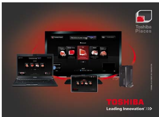
Toshiba Places : le partage accessible à tous et sur tous les écrans.

A la pointe des nouveaux usages numériques, Toshiba Places permet à tous les membres de la famille d'accéder à des contenus multimédias attractifs et de les partager sur tous les écrans (téléviseur principal et secondaire, ordinateurs, tablettes) au sein de leur foyer ou avec leurs proches.